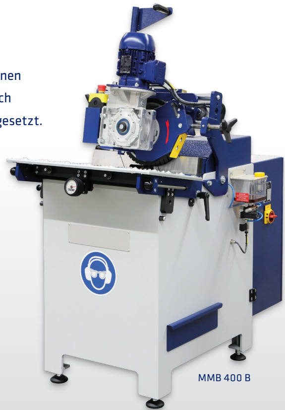
MMB 400 B

Eine hohe Abtragsleistung und Fasenqualität zeichnet diese Maschinen aus. Überwiegend werden sie für Schweißfasen von 15° – 65° und auch für optische Fasen an geraden Kanten, Rohrenden und Platinen eingesetzt.