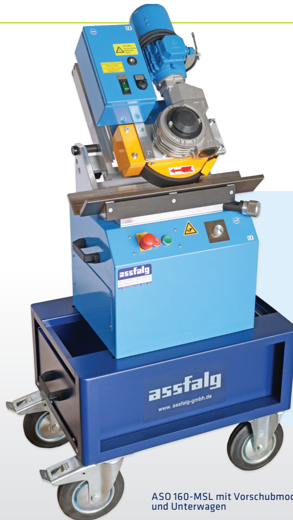
ASO 160-MSL mit Vorschubmodul und Unterwagen