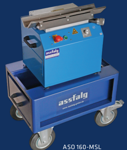
ASO 160-MSL mit Unterwagen