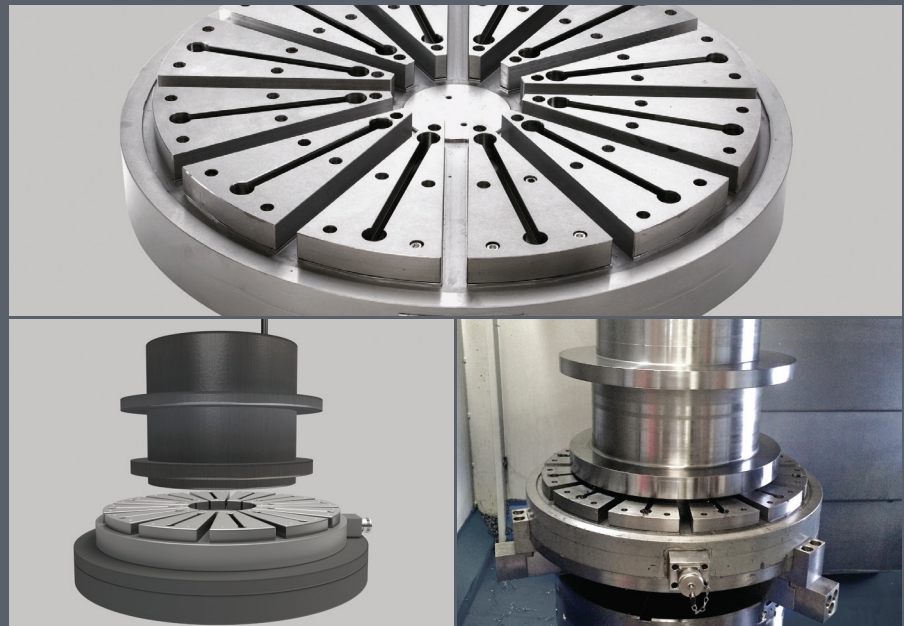
EPRadial bis Durchmesser 600 mm