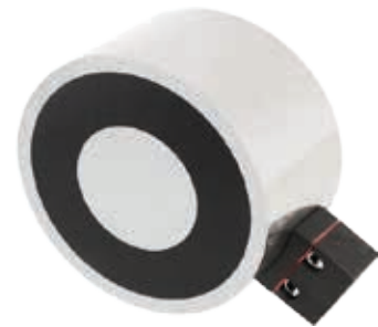
Ausführung B 2-poliger Klemm- anschluss