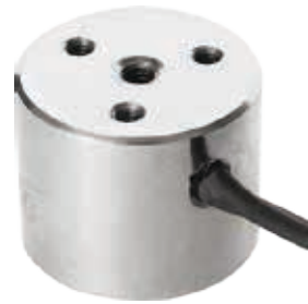
Ausführung A mit 500mm Kabellitze

Hier werden Permanenthaftmagnete verwendet, welche magnetischen Werkstücke erst bei Energiezufuhr loslassen.